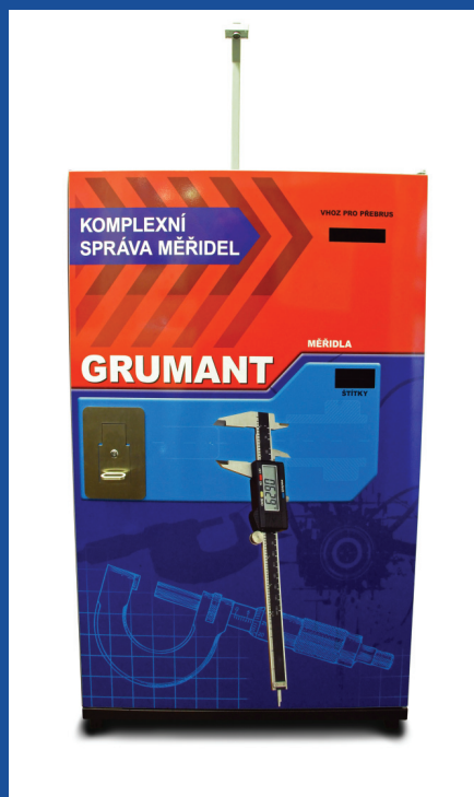
Měřidla ve výdejním automatě jsou k dispozici 24 hodin denně, 365 dní v roce, bezobslužně, jednoduše a bezpečně.