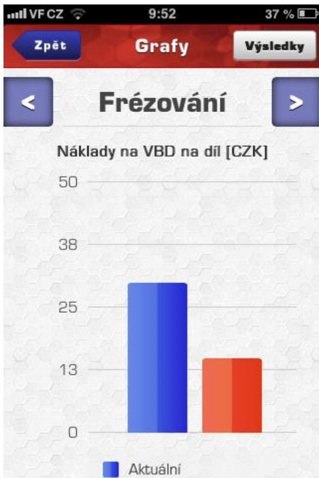
Výsledky – grafy (obr.7)