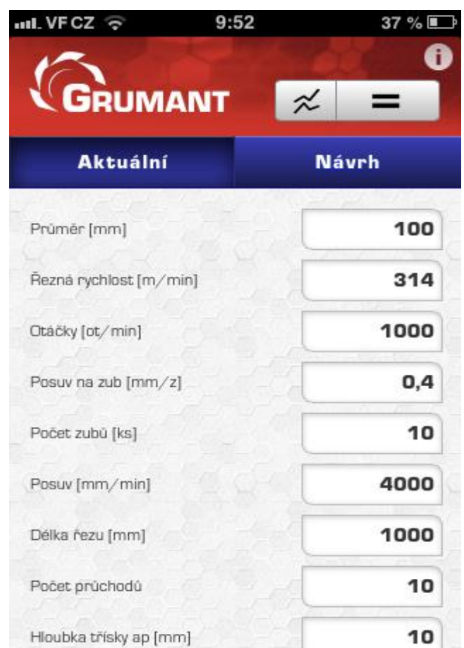
Vyplněné vstupní údaje (obr.6)