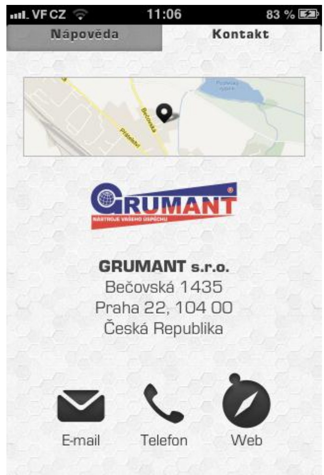
Informace – kontakty(obr.4)