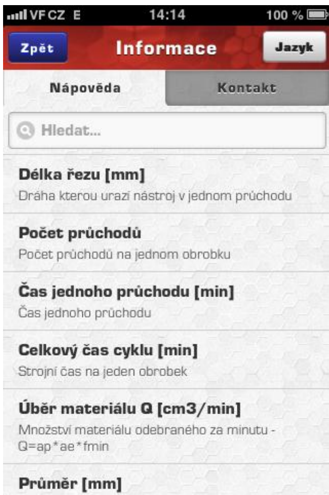
Informace – nápověda (obr.3)