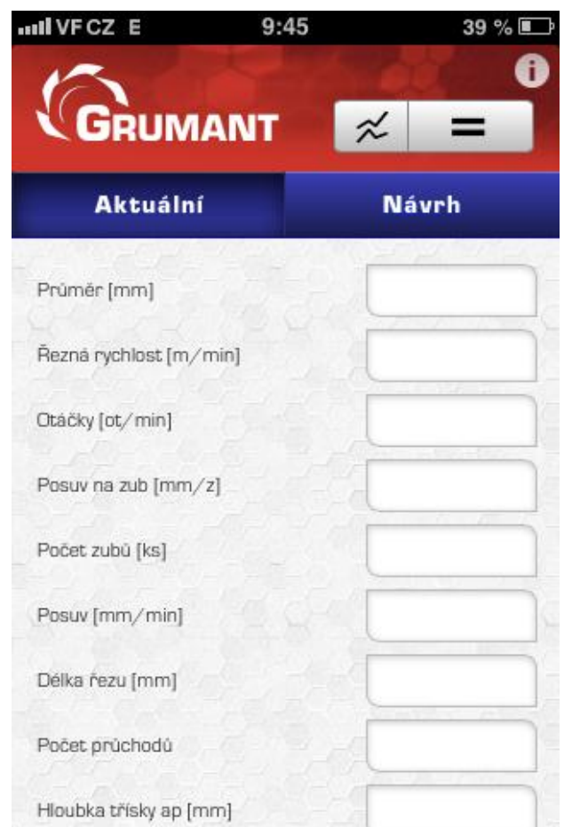
Pracovní rozhraní (obr.2)

V sekci informace je možné měnit i jazyk aplikace, která standardně funguje v češtině a angličtině ( obr.5 ), tudíž není problém prezentovat své výsledky i návštěvníkům a kolegům ze zahraničí. V této sekci naleznete také všechny důležité informace pro komunikaci s pracovníky společnosti Grumant s.r.o. Stačí pouze otevřít podnabídku kontakt (obr.4) a pomocí znakové navigace (sluchátko, dopisní obálka) jednoduše získáte telefonní číslo na centrálu společnosti, e-mailový kontakt a také odkaz na náš web pro případné bližší informace o našich produktech.